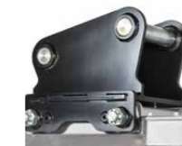
4 Plaque d'attache boulonnée (suivant les mesures)