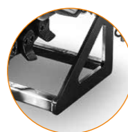
Pied de support pour le positionnement de la machine au repos