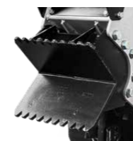
1 Bec escavateur frontal