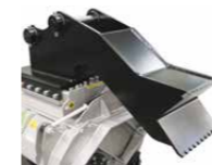
3 Plaque d'attache boulonnée et pied d'appui (suivant les mesures)