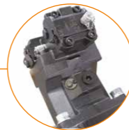
Moteur VT à cylindrée variable pour augmenter la performance et réduire les coûts de service